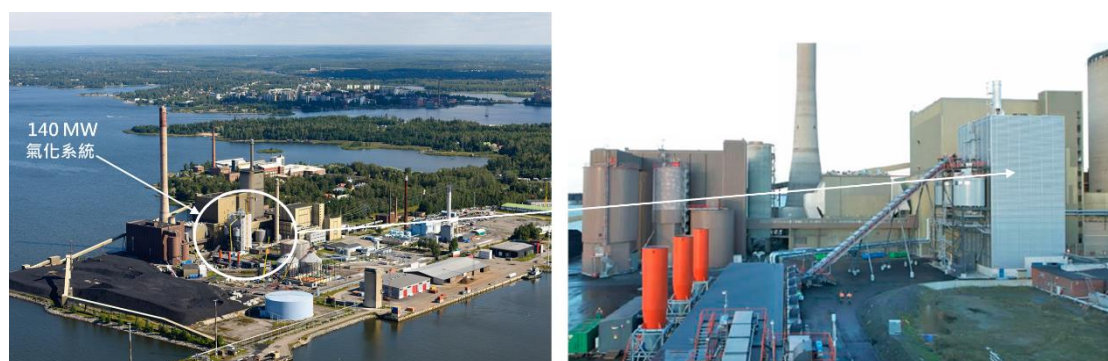
圖 8. 全球最大循環式流體化床氣化爐所在的芬蘭瓦斯基洛托氣化混燒發電系統

的瓦斯基洛托 (Vaskiluoto) 第二電廠建於 1982 年，原是一座供應 230 MW 電力及 175 MW 地區供熱的汽電共生廠，每年使用 32 至 60 萬公噸的煤炭，已於 2013 年在其粉煤鍋爐旁增設一座 140 MW 循環式流體化床氣化爐，為目前全球最大之生質物氣化爐，其以木質生質物料源，產生之氣化合成氣即注入既有之粉煤鍋爐內，可取代原有電廠 25-40% 的煤炭，每年可減少 23 萬噸 CO 2 的排放 (Isaksson, 2015)，如圖 8 所示。上述電廠採用氣化混燒方式是因為原有的燃煤鍋爐是屬粉煤 (pulverized coal, PC) 鍋爐，即把煤炭磨成粉末再噴入鍋爐燃燒，但生質物較難進行研磨，若欲進行生質物的混燒，則適合先將生質物進行氣化後，再以產出之合成燃氣注入鍋爐內進行間接混燒 (吳耿東、李宏台，2002)。