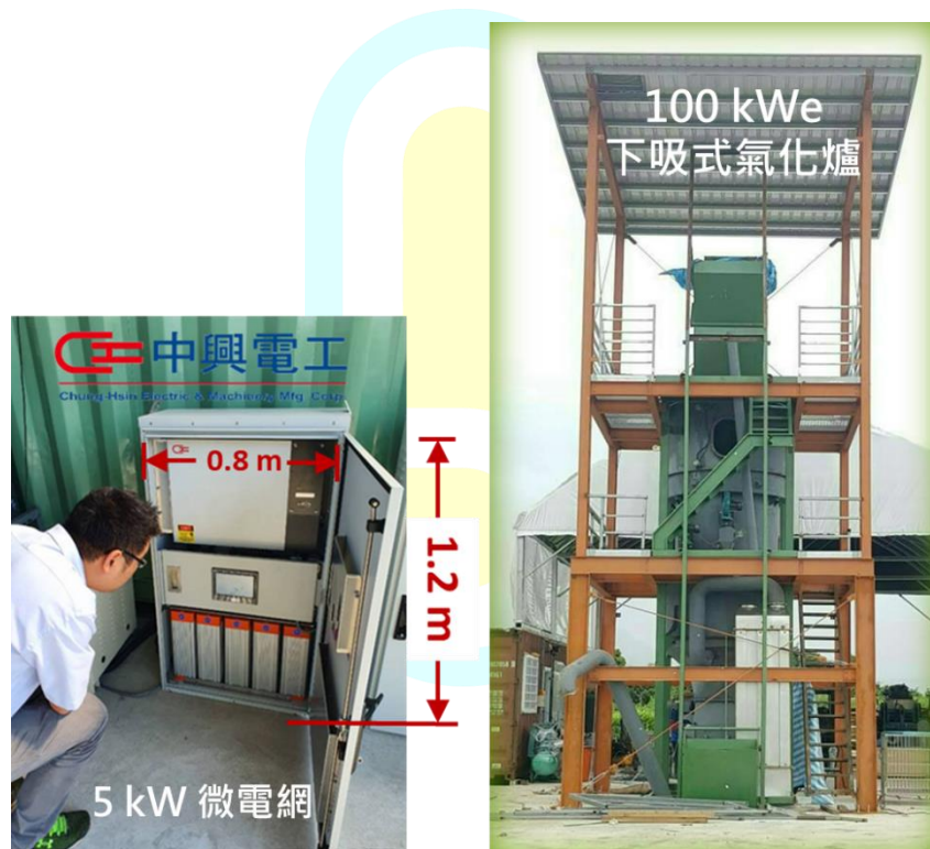
圖 10. 國立中興大學生質物氣化發電微電網系統

在國內方面，工業技術研究院曾於 1999 年至 2004 年在經濟部能源局的資助下，建置國內最大的 900 kWth 循環式流體化床生質物氣化先導系統（工業技術研究院，2004）；近來，在科技部「綠能科技聯合研發計畫」補助下，國立中興大學已建立一座 100 kW e 下吸式生質物氣化發電整合微電網系統（如圖 10 所示），屬商業化之原型系統，也是國內首座結合微電網的氣化系統，利用新式的小型下吸式氣化發電系統，將農業廢棄物轉換為可燃的合成氣後，直接進入新型發電機組進行發電，且無焦油及廢水問題；其所產生的電力經由充電區，進行可攜式熱插拔電池的充電，再將電池送至各小區域的微電網系統，供應個別社區電力之使用。此一技術之成功開發，不僅可大幅降低設置成本，並使生質能發電設施與微電網得以分離設置，增加分散式能源電力應用的廣度與深度（Wu et al., 2020; Wu et al., 2021）；正在進行推廣的這套系統不僅適用於國內的偏鄉地區，也適用於十分缺電的東南亞國家偏遠村落。