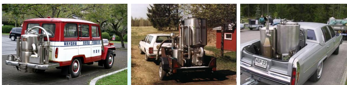
圖 7. 以氣化合成氣作為燃料的現代汽車 (左) 日本岩國市的現代木炭車 (中) (右) 掛有氣化爐的現代芬蘭車輛, 以 130 kg 泥煤 (peat) 為原料, 可跑 130 km