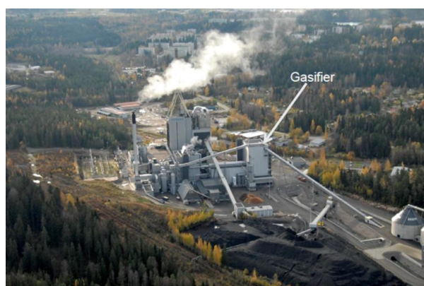
圖 9. 芬蘭凱米耶爾維第二發電廠，為全球首座 SRF 全氣化發電示範廠

另外，隨著氣化技術的成熟，以及依循「循環經濟」理念的廢棄物處理方式，為接續已除役的芬蘭凱米耶爾維電廠，2012 年在其原址建置了全球首座以「固體再生燃料」(solid recovered fuel, SRF) 全氣化的凱米耶爾維第二發電示範廠 (Kymijärvi II)，如圖 9 所示 (Isaksson, 2015)，包括兩座 CFB 氣化爐，可提供 50 MW 電力及 90 MW 的熱能給拉第地區。