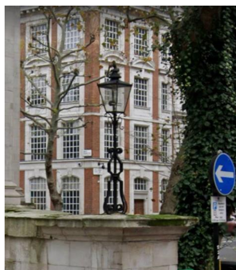
圖 3. 倫敦史密斯廣場聖約翰堂門前的煤氣燈

在 1985 年著名電影《回到未來》(Back to the Future) 的最後一幕，瘋狂科學家布朗博士開來了一台迪羅倫 (DeLorean) DMC-12 跑車 (您可以在環球影城看到這部車)，他打開後車後的反應器，然後說：「我需要燃料!!!」 (I need fuel!!!)，並將一堆香蕉皮、垃圾、啤酒等等置入反應器中 (如圖 4)，然後車子就飛起來了！這個「反應器」就是一個標準的氣化爐概念，雖然在電影中，這個反應器還標示了「核融合」(fusion) 的字樣。這個概念在現實世界中是真的，所不同的是，我們的車子不會飛。