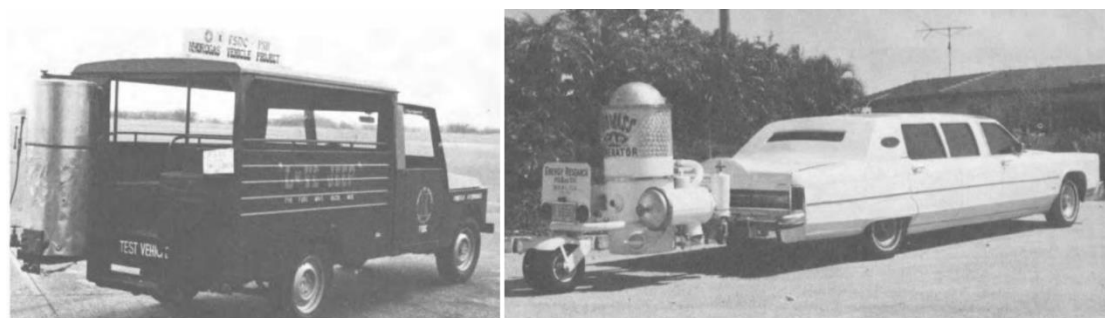
圖 6. 1981 年能源危機時期掛氣化爐的柴油車 (左) 菲律賓馬尼拉的吉普尼 (Jeepney) 木炭車, 使用 20 kg 木炭進行氣化可跑 160 km (右) 美國邁阿密的林肯大陸豪華轎車 (Lincoln Continental limousine), 使用約 50 kg 的木材進行氣化可跑約 137 km