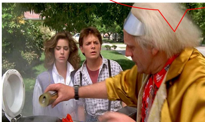
圖 4. 電影《回到未來》的場景